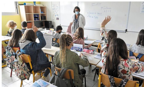
Pour enseigner en collège ou en lycée d'enseignement général, il faut passer le Capes.

23 216 postes sont ouverts aux concours de recrutement de l'Éducation nationale à la session 2021 pour l'enseignement public, selon les chiffres publiés par le ministère ( devenir.enseignants.gouv.fr ). Cela représente 9 900 professeurs des écoles, 12 766 enseignants en second degré (collèges et lycées), 340 conseillers principaux d'éducation et 210 psychologues.