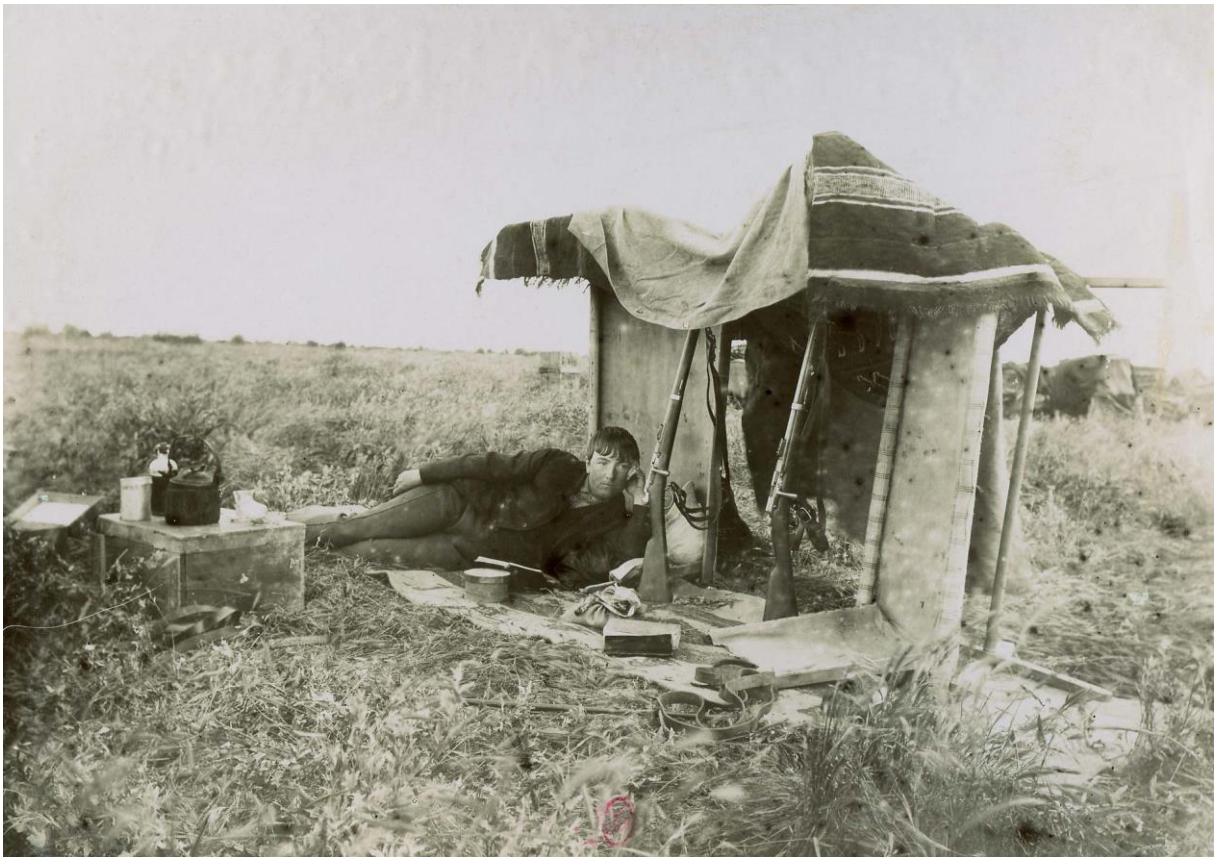
L'archéologue et exploratrice Jane Dieulafoy (1851-1916) se reposant sous une tente de fortune, lors des fouilles de la cité de Suse, en 1885.