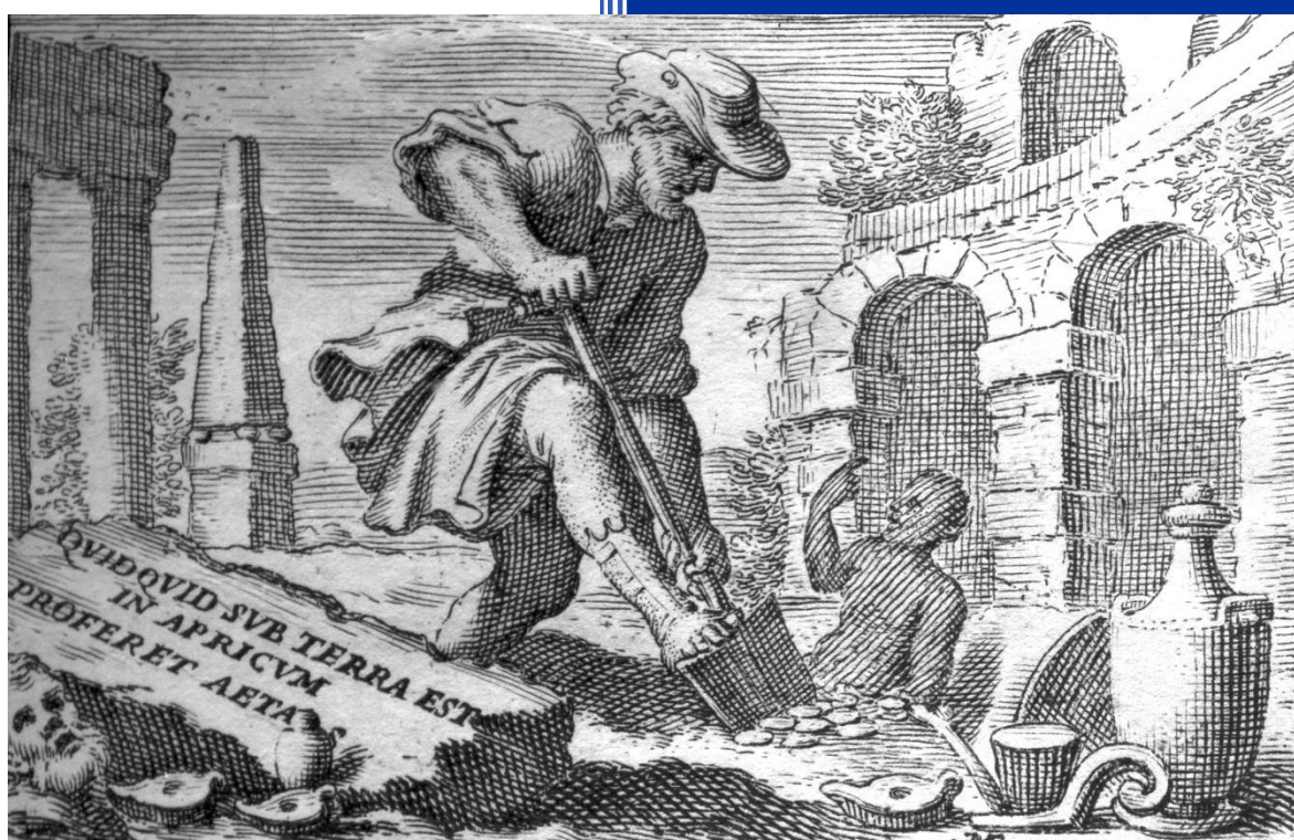
Frontispice de l'édition des Comédies de Plaute , par Giuseppe Comino, Padoue, 1725. Quidquid sub terra est in apricum proferet aetas : « Tout ce qui est sous terre retourne à la lumière avec le temps ».