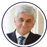
HERVÉ MORIN, Président de la Région Normandie · Président de l'Agence régionale de l'orientation et des métiers